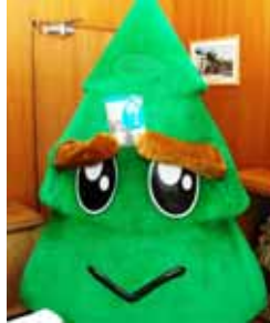
スグッチも喜んでくれました。